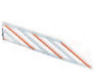
WA13 listwy aluminiowe, zabezpieczające, pod ramię płaskie, w odc. 2 m 320,00 393,60 brutto