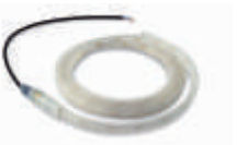
XBA6 diodowe światła ostrzegawcze, 6 m 200,00 246,00 brutto