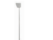
WA12 podpora ramienia ruchoma 260,00 319,80 brutto