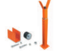
WA11 podpora ramienia stała, regulowana wysokość 260,00 319,80 brutto