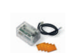
XBA7 moduł lampy sygnalizacyjnej do szlabanów BAR 175,00 215,25 brutto