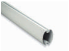
XBA15 ramię aluminiowe, owalne, 69x92x3150 mm 200,00 246,00 brutto