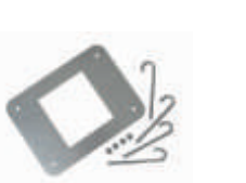
XBA16 płyta montażowa z kotwami 200,00 246,00 brutto