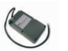
PS224 akumulator 24V 7.2 Ah z wbudowaną kartą ładowania 450,00 553,50 brutto