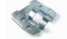
XBA10 uchwyt przegubowy dla ramion 3 lub 4 m 370,00 455,10 brutto