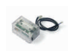
XBA8 moduł semaforów do szlabanów BAR 250,00 307,50 brutto