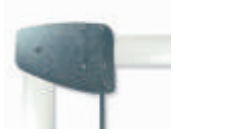
XBA11 przegub dla ramion XBA15 (od 1950 do 2400 mm) wys. po podniesieniu 480,00 590,40 brutto