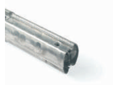
XBA9 łącznik do ramion 80,00 98,40 brutto