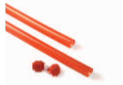
XBA13 listwy ochronne, gumowe, czerwone na ramię XBA, 9x1 m 120,00 147,60 brutto