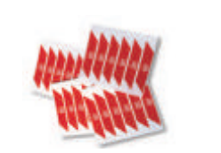
WA10 nalepki ostrzegawcze na ramię szlabanu (24 szt.) 80,00 98,40 brutto