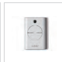
Pilot XT4 433 RC str. 78