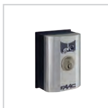
Wyłącznik kluczykowy str. 84