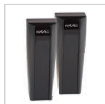
Fotokomórka XP15B str. 83