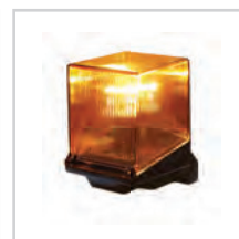
Lampa FAACLIGHT str. 82