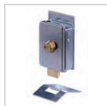
Elektrozamek str. 85