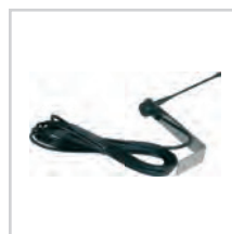
Antena str. 79