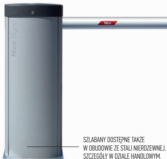
SZLABANY DOSTĘPNE TAKŻE W OBUDOWIE ZE STALI NIERDZEWNEJ. SZCZEGÓŁY W DZIALE HANDLOWYM.